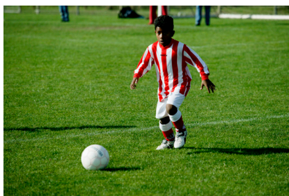
COULEUR DU GAZON