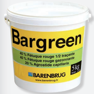
Shoot density STRI 2014